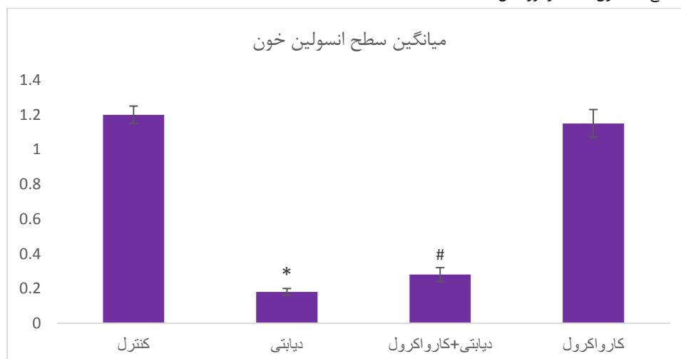
شکل ۲- ب. مقایسه سطح انسولین خون ناشتا در گروه‌های مطالعه

* معنا داری با گروه کنترل # نشان دهنده معنا داری با گروه دیابتی