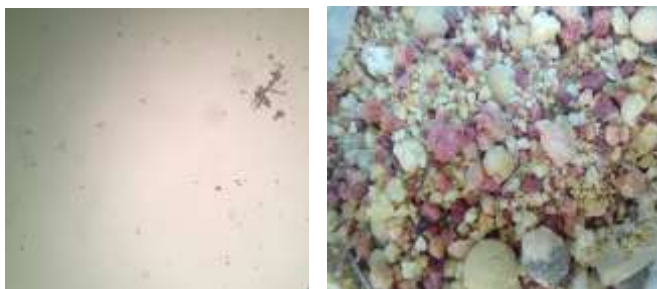
تصویر ۲: تصویر ماکروسکوپی اندروت (شکل راست)، تصویر میکروسکوپی اندروت با بزرگنمایی \times 10 (شکل چپ)