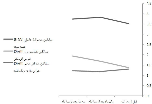
نمودار ۱: توزیع میانگین ITGV (حجم گاز داخل قفسه سینه)، SReff (مقاومت راه هوایی اثربخش) و FEV1 (حداکثر حجم هوایی بازدم، یک ثانیه)