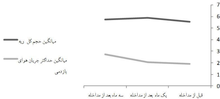
نمودار ۲: توزیع میانگین TLC (حجم کل ریه) و PEF (حداکثر جریان هوایی بازدمی) درصد قبل و بعد از مداخله در بیماران شیمیایی