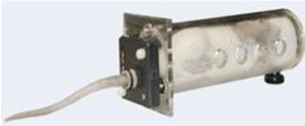
شکل ۱: دستگاه بی حرکت کننده (Restrainer)

گروه تحت بی حرکتی مزمن، ۲ ساعت بی حرکتی در روز به مدت ۲۱ روز را تجربه کردند. جهت اعمال استرس بی حرکتی از دستگاه محدود کننده ویژه ای که عمدتاً در کارهای تحقیقاتی برای بی حرکت کردن موش ها استفاده می شود و بدین منظور توسط مرکز تحقیقاتی دانشگاه تهیه شده بود، استفاده شد. دستگاه طوری تعبیه شده است که بدون اینکه دست و پای موش بسته باشد، فضایی برای حرکت وجود نداشته، همچنین منافذی برای تهویه هوا در دستگاه وجود داشت (شکل ۱).