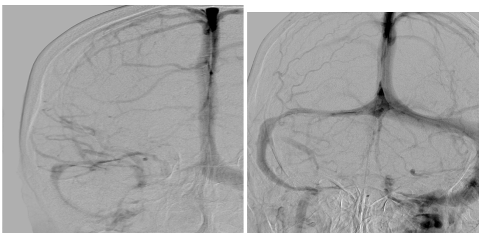
شکل شماره ۲: خانم ۴۷ ساله با ترومبوز سینوس لاترال راست (تصویر سمت چپ) بعد از ترومبولیز موضعی هر چند در مقایسه با سمت چپ قطر سینوس لاترال راست کوچکتر است منتهی جریان خون کاملا برقرار است و از اتساع وریدهای کورتیکال به میزان زیادی کاسته شده است (تصویر سمت راست)

در روزهای بعد از عمل، بیماران شواهد بهبودی قابل توجه بصورت کاهش سر درد و از بین رفتن تاری دید داشتند. البته بعلت اینکه قبل از عمل و بخاطر شدت سردرد بیماران همکاری لازم جهت انجام پریمتری را نداشتند، این تست مجددا درخواست نگردید و فقط بهبودی بالینی دید که از طرف بیمار عنوان می‌گردید و معاینات فوندوسکوپی، مد نظر قرار گرفت. MRV کنترل، باز بودن درناژ سیستم وریدی در طرف‌های مبتلا را نشان داد. هر سه بیمار چهار روز بعد از درمان با حال عمومی خوب، بدون سردرد و تاری دید و با درمان دارویی آسپرین ۸۰ mg روزانه و توصیه به عدم مصرف