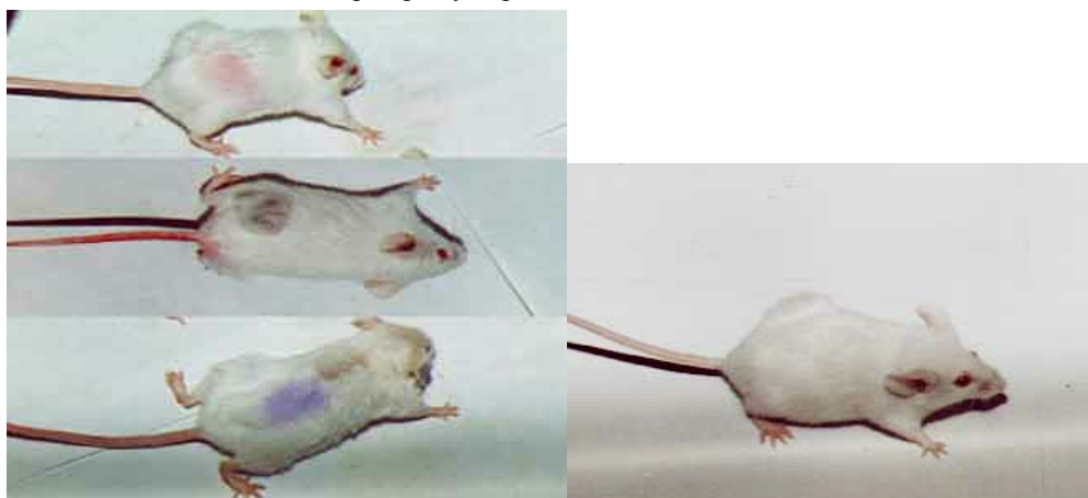
شکل: موشهای بیمار نشده و بیمار شده

VT1= Verotoxin 1, MPL= Monophosphoryl Lipid A