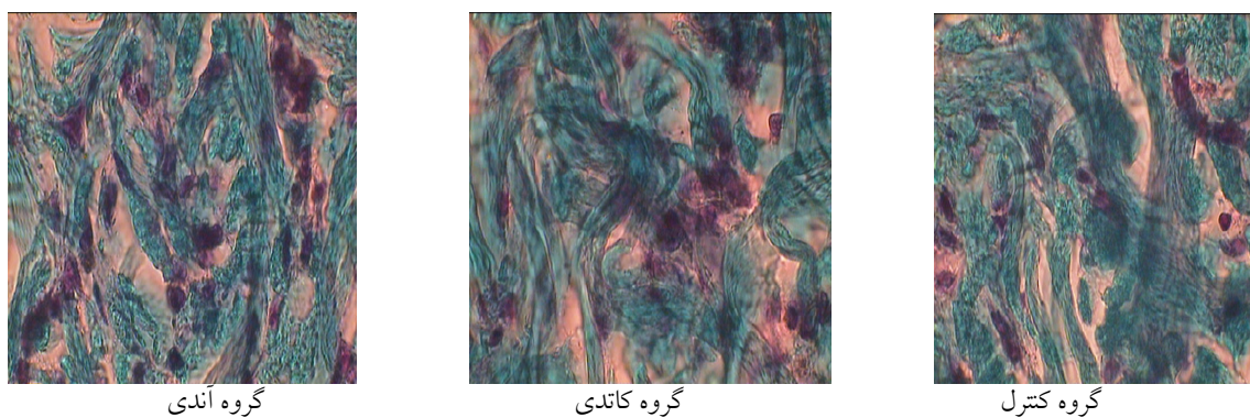
شکل ۲: جهت گیری رشته های کلاژن در روز ۲۱ ترمیم در سه گروه مختلف، رنگ آمیزی تریکروم ماسون با بزرگنمایی ۱۰۰۰