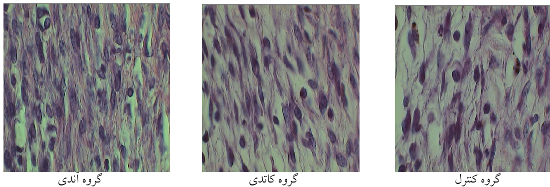
شکل ۱: تعداد فیبروبلاست ها در روز هفتم ترمیم در سه گروه مختلف، رنگ آمیزی هماتوکسیلین - ائوزین با بزرگنمایی ۱۰۰۰